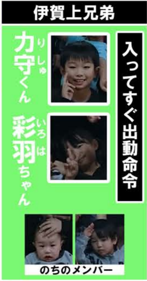
伊賀上兄弟 入ってすぐ出勤命令 カ守くん 彩羽ちゃん のちのメンバー