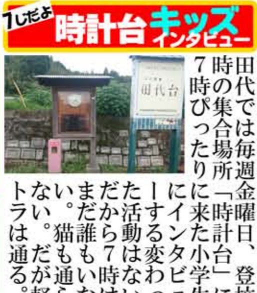
時計台キッズ 田代では毎週金曜日、登校7時の集合場所「時計台」に1時間来たり小学生にインタビューする変わった活動は7時からまだ誰も通らない。猫も通らない。猫も通らない。猫も通らない。

ふるさとほせ祭り めちゃ晴れ 11月10日、上市来ふるさとほせ祭りが開催され中学生が英語の歌を熱唱した。その中に異彩を放つダンスはなんの姿があった。ビデオカメラを左右にパンしながら全体を撮影したが、どうしてでもダンスはなんの姿があった。ビデオカメラを静止してしまおう。青空の下、坊主頭と眼鏡とイングリッシュが同時に視界に入り、ダンスは世界に巻き起こすカオスな世界に没頭してしまった。青空とイングリッシュとダンスはなんの姿があった。ビデオカメラを意味フルなダンスはなんの姿があった。